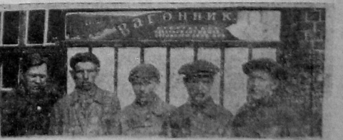
Степанага «Тяговик» — организатор побед многоклассов ВЭС. У газетной группы рабкоры цеха.

— О — Художественная часть. Вход по пригласительным билетам.