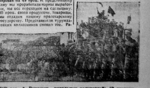
Парод частей Вологодского гарнизона.