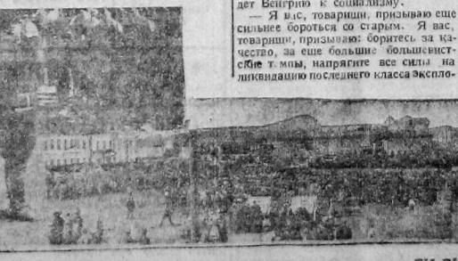
В середине—вид демонстрации с балкона гортеатра. Справа: парад частей Вологодского гарнизона.