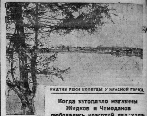
РАЗЛИВ РЕКИ ВОЛОГДЫ У КРАСНОЙ ГОРИ.

В ВЕЛЛИНГТОНЕ (столица Новой Зеландии) происходит демонстрация безработных, пытавшихся прорваться в здание парламента. Между демонстрацией и полицией завязалась ожесточенная б.рба. Многие ранены. Произведен ряд арестов.