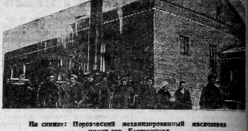
На снимке: Порошевый мехпакетированный маслозавод имени тов. Бергвицкогоса.

Помощью собранного материала о проведении этого конкурса и о прорывах в ходе маслозаготовок в районах, обслуживаемых отделением «Союзмолоко», мы требуем конкретные виновников этих прорывов привлечь к строгой ответственности.