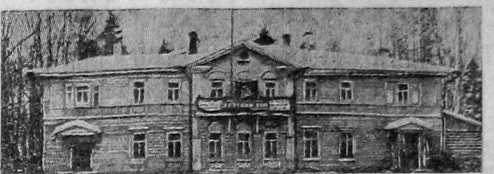
На снимке: здание Шалыгинского детского комбината на 90 чел. (Ватлаковский сельсовет). Комбинат имеет школу, интернат и утход.

7 апреля на всех делегатских собраниях проведены доклады: «Ликвидация беспризорности и борьба с детской правонарушителями». Делегатки выделили в своем докладе ряд задач по ликвидации беспризорности, по организации субботников по пошивке белья и платя.