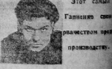
Этот самый Гапиевский снискал славу рвачества и оппортунизма.

чужей вет агитации против организации ударных бригад.