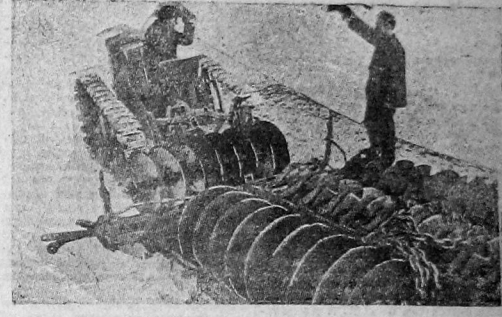
ПЕРЕД СЕВОМ. Отправка сельхозмашин в пригородный колхоз из тракторной мастерской Колхозсоюза.

Внимание проверке выполнения директ в. Новый план своей работы на II квартал горком построил таким образом, что каждый вопрос будет ставиться под углом проверки выполнения директив. Этот принцип горком сохраняет полностью в основу плана всех ячеек и партийных фракций. Второе, на что горком обращает особое внимание, — это задача укрепления советского и кооперативного аппарата в пригородных сельсоветах. Два месяца, в течение которых пригородные сельсоветы работают под руководством города, показали, что на этом участке небольшая большая классовая деятельность. За короткий срок период времени вскрыты вопиющие правые дела, отсутствующие в прошлом решительного наступления на уклана, который в отдельных случаях удерживался в колхозах.