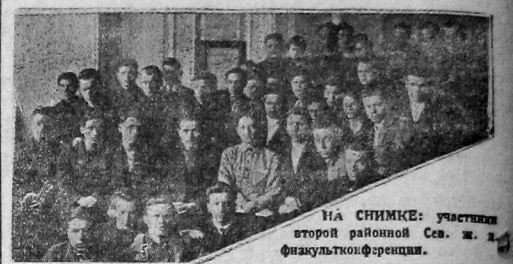
На снимке: участники второй районной Сев. ж.-д. факультетской конференции.

Конференция ставила основной своей задачей перестройку факультетского по производственному принципу.