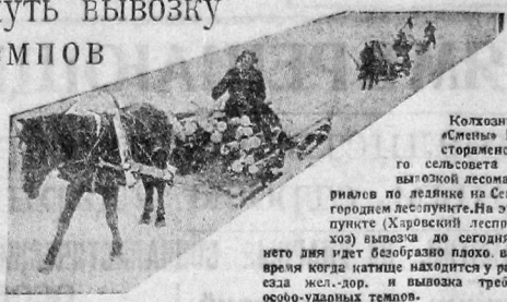
Колхозники «Красный Октябрь» севхоза за вывозкой лесоматериалов по лесной на Семилетнем лесопункте. На этом пункте (Харьковский лесопункт) вывозка до сегодняшнего дня идет безобразно плохо, в то время когда катится на убыль и вывозка требует особо ударных темпов.

Нефтодевский лесопункт — план рубки выполнен на 83,8 проц., вывозка — на 72,5 проц. Прирост за 1 декаду по рубке 24,3 проц., по вывозке — 13 проц. Благодаря ожесточенной работе и усиленному темпу в Феофановский лесопункт до 30 марта плетущийся в самом худшем, сейчас занял среди лесопунктов третье место.