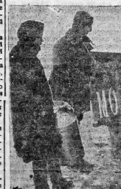
Молоко из фермы пригородного хозяйства ЦРК несут в город.

Райкомы ВКП(б) и райисполкомы организации имеют целью революционизировать, но не работать, не проводить своих постановлений в жизнь. Районы уполномоченные, выезжающие