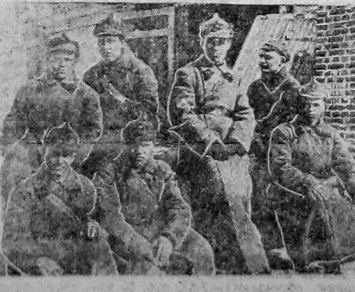
Методики соцсорев. озания и удар. ичества крепим мощь Красной Армии.

Пора положить конец безобразному снабжению дровами.