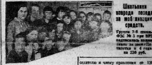
Школьники впередии подождо за мобилизацию средств. Группа 7-6 школы ФЭС № 3 при ВРЗ подписала коллективный заем «Пятилетка в 4 года» на 230 руб.

РКИ необходимо срочно наказать саботажников. Плохо проводят мобилизацию средств жилищно-строительная кооперация. Так обследован ссидки РКИ горсовета выявлена безотрадная картина. ЖАКТ «Об'единение» выполнил квартальный план лишь на 62 проц. До сих пор не принято никаких мер к ликвидации задолженности по паясам взносам в сумме около