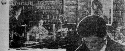
На снимке вверху: главная лаборатория Северной красной семенной контрольной станции НКЗ, внизу на снимке: практикант за сортовым анализом семян.