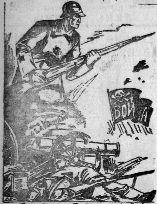
...Поднимется, мстителем, суравой и буфты он вас посылит...