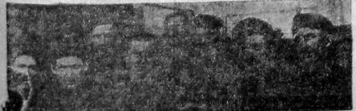
Ударник инструментального цеха ВРЗ.