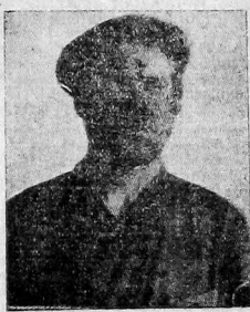
один из лучших из ударников ВРЗ, рессорщик кузнечного цеха, награжден почетным знаком ударника и премией (костюм).