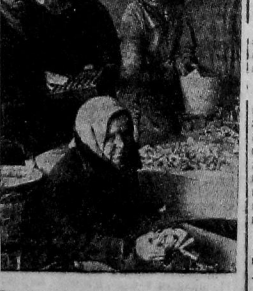
Выдача продуктов питания для детей. Бюрократ, организовавший во время отчетных собраний горсовета.

Н. О. (Сводку предложений рабочих ВРЗ к новому наказу горсовета мы напечатает в ближайшем номере).