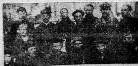
Бригада обойщиков и маляров ВРЗ.

Ударники ВРЗ должны стать главными отрядами предприятий Вологды в борьбе за полное выполнение и перевыполнение производственных планов.