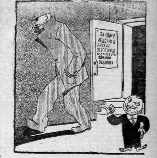
Рис. М. Храповского.

Реформист: — У нас рабочий класс — самый СВОБОДНЫЙ в мире.