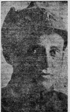
Курсант полкшколы 10 артиллерийского полка. Ударник имени К. Е. Ворошилова. Под его руководством взвод крас-цев вступил в колхозы объявив себя колхозным взводом.

Тотемская красноармейская коммуна 10 дивизии прислала рапорт к 13 годовщине РККА, где говорит о своих успехах. Несмотря на ряд больших трудностей, коммуна за короткий срок образовала поставила свое хозяйство, ставила лучшей в своем районе, дивизионный раз доказывая этим правильность своих действий.