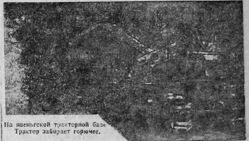
На ивельской тракторной базе. Трактор забирает горючее.

Всякий прогульщик, лодыр, рвач своим поведением помогает классовым врагам Советского союза и не достоин быть в рядах рабочего класса. Мы требуем от подонков леспромхоза и лесной тумы бригады 25 рабочих ВРЗ уволить темпа своей работы безоговорочно доблжась выполнения и перевыполнения программы. Северный край несмотря на трудности будет индустриальным социалистическим Севером. Да здравствует социалистическое темпы роста Северая.