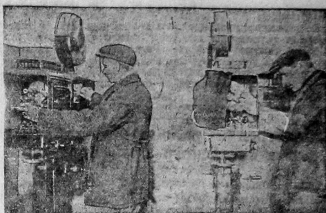
Клуб Октябрьской революции Вологодского ж.д. устал своей обочинной работой занял второе место на все жемом конкурсе клубов. Клуб премирован звуковым кино, которое в ближайшее время будет заменено звуковым кино.