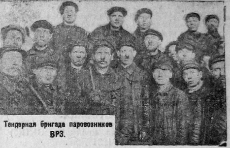
Тендерная бригада паровозников ВРЗ.