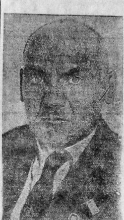
Н. В. КРЫЛЕНКО.