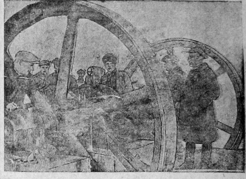
Пробный пуск в ход двигателя холодильника.