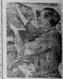
Швейная фабрика Госшвейтреста № 13 в Вологде премагана 5000 руб. за выполнение профплана. Улария швейной фабрики 14 годовщины Октября изготовила субботником 440 брюк, 450 подпальцов, 380 телогреек и 180 шапок для рабочих лесозаготовок Северного края. На снимке: С.Трикопа шапок перед отправкой на лесозаготовку.

10. Пленум ЦК подчеркивает необходимость оказания технической помощи делу коммунистами и беспартийными торговыми работниками. В связи с этим пленум предлагает Наркомсбы и Центросоюзу развернуть сеть визитов и курсов по подготовке специалистов в технику торгового дела, в особенности товароведа, а также организовать вечерние курсы для переподготовки, в целях подема