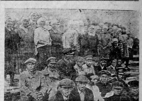
Ударики 44 лесозавода на летнем митинге обсуждают план мобилизации средств.

К 14 ГОДОВЩИНЕ ОКТЯБРЯ ВЫПОЛНИТЬ 50 ПРОЦ. КВАРТАЛЬНОГО ФИНПЛАН.