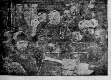
Давить культурно-массовую работу в лесную избушку. На снимке лесорубы слушают доклад о хозяйстве; (Славский лесопункт, Грязовецкий район).

твердую уверенность в том, что в ближайше десятилетии мы не только достигли, но и перегоним в хозяйственном развитии буржуазные страны с наиболее развитой техникой и промышленностью.