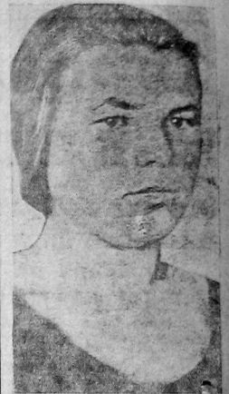
Ударинок Соколова (кохоз «Платье Основного сельхозта») препитывая бубню в слете колхозов.