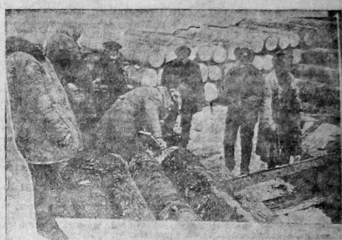
Объем леса на катках. Лесной лесопункт Вологодского лесхоза.

Войдем в ряды организованного рабочего класса—в ряды профсоюза.