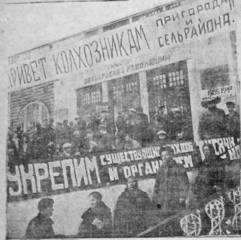
У здания клуба КР