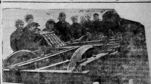
Ремонт тележки пассажирского вагона на Вологодском ремонтном.

Переборы цеховых партийцев прошли с большой активностью. Работы бюро ячеек была подвергнута широкой самокритике. Выявлен целый ряд крупнейших недостатков в работе ячеек. Некоторые из них уже устранены. Переборными собраниями охвачено свыше полсотни тысяч беспартийных рабочих. 55 удар-