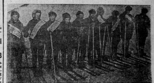
В течение всей перевыборной кампании Вологодский городской совет физкультуры ежедневно направляет в отряды агитпроб в сельсоветах пригородного района бригады учащихся физкультурников и лыжников. Бригады полностью снабжены повестками, материальными, брошюрами тов. М. Калининна

165, 166, 167, 168 не участвовавшим в первом собрании и проживающим во Флотском поселке (деткомната в кожзаводе и д. с. № 18) — в 6 час., в школе семилетке № 21 ст. (б. торговая школа) ЗАТРА, 31 ЯНВАРЯ. ГОРНО, центр библиотеки, арх. бюро, швей. и д. с. № 3, 17, 7, 12, 13, 15, 20, краевой музей, школа № 11 ст., № 2-1 ст., № 3-1 ст., № 5 1 ст., № 6 турдуновскит., № 8 1 ст., № 9 1 ст., № 10 1 ст., № 11 1 ст., № 12 1 ст., № 13 1 ст., № 14, 7, 18, школа № 13 впомпост., кв. № 2-вном, шк. № 14, 1 ст., шк. № 16 1 ст., шк. № 17 1 ст., Вологодский музей, особая комиссия ликбеза, детский приемник, школа взрослых, ДРП (детская комната в горсоуде) — в 6 час., в колхозтехникуме Рабочие и служащие ФЗС № 1, 2, 3, 4, 5, ФЗУ коммунальщик — в 6 час. в совпартишколе. Рабочие и служащие ЦРК торговой сети (2 группа), Сопознатель и безработные члены союза СТС (детская комната в д. с. № 6 и горсоуде) — в 6 час., в клубе «Красный Луч». Вологодский РИК и райком, Волог. райколхозсоюз, Вологод. раймолодежьсоюз, Артедьсоюз, Лесхимсоюз, Кружсоюз, Автодор, ОДД, т-во охоты, кустарпромиссия, райиндент, т-во, райПО (детская комната в горсоуде) — в 6 час., в зале рабкома МКХ. Общцы перевыборное собрание № 13 в клубе КОР и ж.-т. садах — в 6 час. в театре.