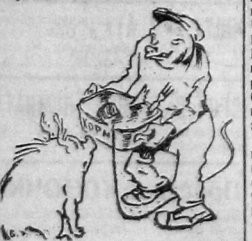
В ЦРК со свиньями обращаются по-свиному.

1 января была создана комиссия для вскрытия одной свиной, которая подала. Когда комиссия во главе с врачами КИРИКОВЫМ, ВАНЕ-