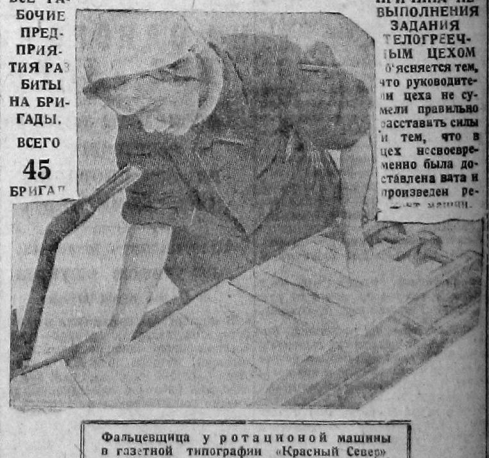
Фальшивщица у ротационной машины в газетной типографии «Красный Север».

ВСЕ РАБОЧЕ ПРЕДПРИЯТИЯ РАБОТЫ НА БРИГАДЫ ВСЕГО 45 БРИГАД