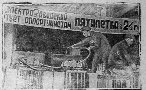
Московский электротехнический завод выполнит пятилетку в 2 1/2 года. Ударники транспорта второго отдела сборочного цеха № 2 — за работой.