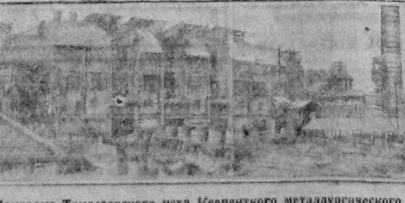
Панорама Тамассанского цеха Черепного металлургического завода.

Общее собрание членов вологодского отделения ВАРНИТОСО состоит 12 октября в 6 ч. веч. в здании ГОРСОВЕТА, 3 этаж комната № 30.