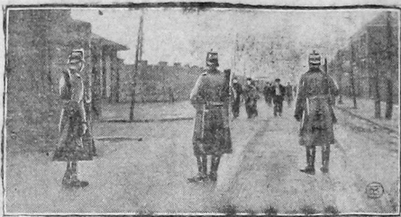
Штейнбрехеры под охраной полиции идут на работу.

БЕЙЛИН, 8 октября. Митинг, организованный гоминданом в Шанхае в связи с японскими событиями, превратился в мощную 60-тысячную антигоминдановскую демонстрацию. Председатель митинга членом гоминдана и чиньшайские офицеры были обвинены демонстрантами. Многие ораторы провозгласили революционные требования.