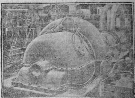
Перед смонтированной турбовоздухулка на Негитостое.