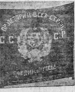
Знамя Северной дивизии.

ЭФФЕКТИВНО И СЛАЖЕННОСТЬ НА МАНЕВРАХ ПОКАЗАЛИ СВЯЗИСТЫ ДИВИЗИИ, ОБЕСПЕЧИВ НА ПРЯМОЙ ЛИНИИ ХОДА БОЕВЫХ ОПЕРАЦИЙ БЕСПЕ- РЕРВАННУЮ СВЯЗЬ.