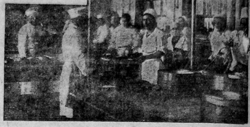
Приготовление обедов в столовой ВРЗ.

Горпрофсовет обязал профорганизации немедленно приступить к проведению практических мероприятий по месячнику. На местах должны быть созданы тройки по смотр и ремонту столовых. Волкоопит и все правления кооперативов обязаны сейчас же заняться вопросом улучшения общественного питания. К. ПАВЛОВСКИЙ.