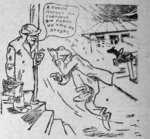
Перед собранием на «Северном Коммунаре».