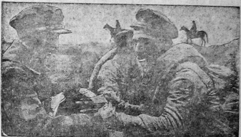
РОКК на маневрах.