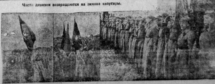
Части дивизии возвращаются на зимние квартиры.