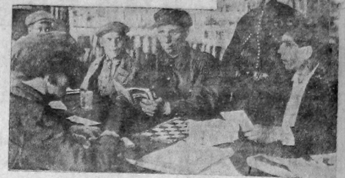
Беседа на агитпункте.