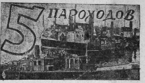
НА ПОМОЩЬ ДВИНЕ.

В ГЕРМАНИИ. Ежедневно со всех контор Германии поступают сведения о количестве предприятий и о массовых увольнениях рабочих в августе. В Саксонии за первое полугодие обанкротилось 1.100 предприятий. 13 августа в Германии, по предварительным официальным данным, было уволено 4 миллиона 104 тысячи рабочих, с которых не было получено 1.120 копеек пособия по безработице.