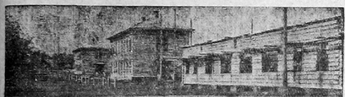
Новые дома в Октябрьском поселке.

10. В декандный срок отделе кадров по согласованию с фракцией горсовета усилить отдел местного хозяйства и коммунальные предприятия проверками на опыте крепкими руководящими работниками. 11. Проведение плана коммунального строительства, составленного на основе определенных данных решением контрольных цифр—требует от всех организаций, в первую очередь от горсовета и коммунальных органов деятельности и выполнения их работы лицам к обслуживанию нужд рабочего класса, решительного разоблачения и борьбы с правым оппортунизмом, тормозящим наше социалистическое строительство и olevым проектам. Боро горкома предлагает всем партийным, фракциям советских, профсоюзных и ком. организаций разрешить обсуждение этого решения среди широких трудящихся масс и организовать большинство его выполнение.