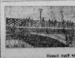
Новый мост через реку Вологод.