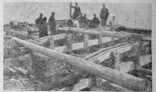
50 паротурбинных агрегатов ВКЛ/2 для лесной промышленности Северного края. НА СНИМКЕ: испытание законченного 50-го агрегата на «Северном Коммунаре».