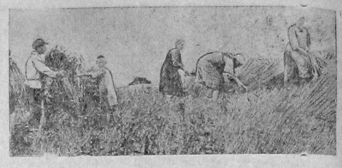
Уборка зерновых культур в колхозе «Пионер».

Связь на ряду субарной зерновых по боевому проводим сеноуборку. Сто тонн излишков сена и соломы забронированы за нашим Севером молочно-животноводческим гигантом совхозом «Молочное». Задача учат как нужно бороться за повышение продуктивности животноводства и подведение кормовой базы всем колхозам пригорода и района следует учиться у колхозников имени Ленина. Г. Козинев.