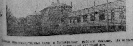
Новые многоквартирные дома в Октябрьском рабочем поселке. На первом этаже жилищ и на втором строительный дом.