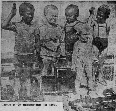
Самые юные подписчики на заем.

Подписка на заем третьего решающего года по единоличному сектору в Вологодском сельрайоне на 25 июля выражается в следующих цифрах: Гаврильинский сельсовет—контрольное задание—9.300 руб., а подписка—5.845 рублей. Беловский—задание 5.000 рублей, подписка—3.295 руб. Гончаровский—зад. 10.000 руб., подп.—7.915 руб. Емский—зад. 2.900, подписка—465 рублей. Заболотский—задание 9.500 руб. подписка—5.165 руб. Лихтоской—зад. 16.800, подп.—6.300 руб. Марковский—зад. 17.900 подп.—10.750 руб. Нороловский—зад. 4.000, подписка 3.050 руб., Гореловский—зад.—12.700 руб., подп.—11.970 руб. Пухтиский—зад. 7.600 подп.—7.050. Обаский—зад. 5.300 руб. подп.—2.600 руб. Тошненский—зад. 9.000 руб., подп.—4.605 руб. Хреновский—зад. 17.500, подп.—6.290 руб. Всего задано—128.400 рублей, подписка—75.200 руб. В эту цифру не входит подписка сельсоветов: Рабоче-крестьянского, Бреховского, Пудеговского, и Ягросорского, от которых сведений не получено.