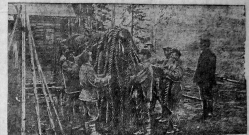
Развеска снастей для просушки на веналах по окончании сплава в Высокойский заповедник.

организации и создания лесной кооперации, максимального ускорения перестройки низовой