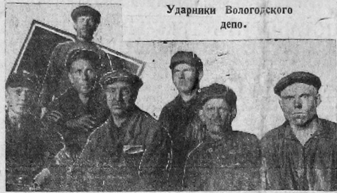
Ударники Вологодского депо.

Эти решения производственного товарищеского суда должны послужить грозным предупреждением для всех врагов спаренной.