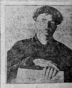
На слете колхозников.