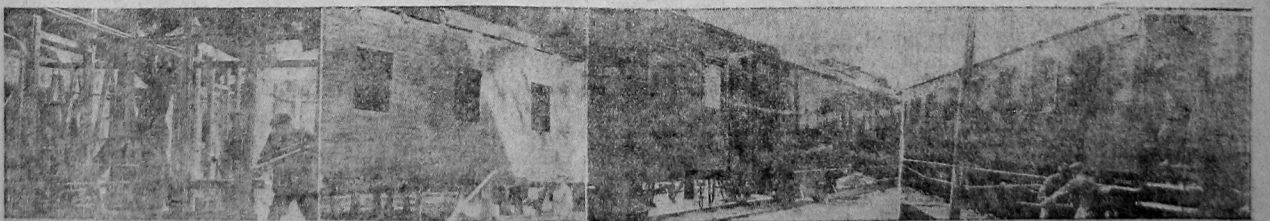
НА НАШИХ СНИМКАХ. Слева направо—ударники кузовной бригады вагонного цеха на стройке каркаса нового вагона. Законченный кузов нового вагона. Обшитые вагоны переводятся из вагонного цеха в маляжный для окраски. Проверка вагона, пришедшего из обкатки.