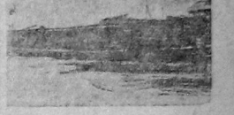
25 таких барк стоит в Сухонском порту в ожидании разгрузки.

Мы ни на минуту не сомневаемся в том, что вологодские водники примут все необходимые меры, обеспечивающие боевую работу на сплаве и путем широкого разветвления социалистического соревнования и упорничества, путем беспощадной борьбы с прогульщиками, пьяницами, лгунами и всеми тунеядцами производства, добьются победы на фронте сплава.