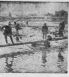
Сплав на р. Вологде.

СЕГОДНЯ В РЕДАКЦИИ ВЫХОДНОЙ ДЕНЬ. Следующий № «Кр. Сев.» выйдет 21 мая. ЗАВТРА СЛУШАЙТЕ «КРАСНЫЙ СЕВЕР ПО РАДИО».