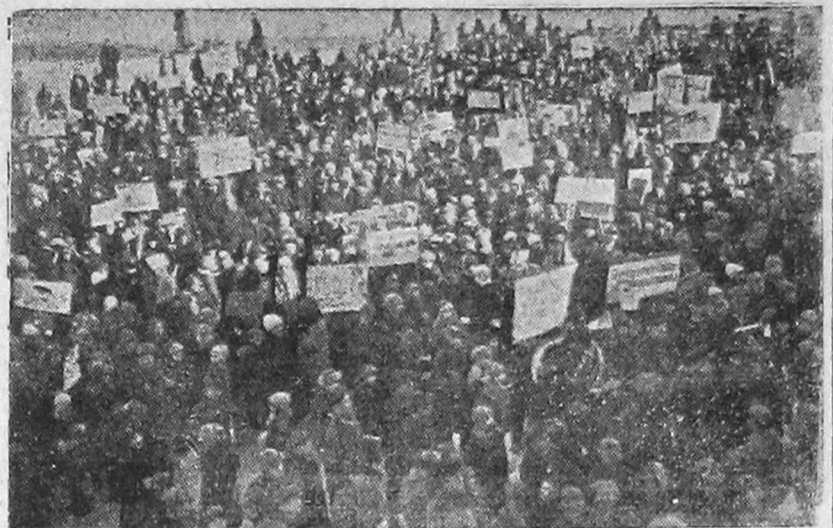
Многократный митинг юных пионеров и школьников перед зданием горсовета в день птицы в Вологде.

Весна на дворе. Начали появляться пернатые гости с юга. Многократной демонстрацией вчера юная детвора Вологды отмечала день птицы.