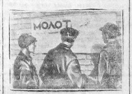
Рабочие курского машиностроительного завода им. Галинина читают в стенгазете «Молот» о первых результатах похода рабкоров навстречу 3 году пятилетки.

НАРОДНЫЙ КОМИССАР ПО ИНОСТРАННЫМ ДЕЛАМ тов. М. М. ЛИТВИНОВ получил от министра иностранных дел Турецкой республики г. Тевфик Рушди-бея следующую телеграмму: «Покидая территорию Советского Союза, я счастлив с вами принять долгую благодарность за тот горячий и сердечный прием, который дружественное правительство и вы г. Народный Комиссар, оказали мне и в особенности в моем лице турецкой республике. Я прошу вас принять заверение в моем высоком почтении и искренней дружбе».