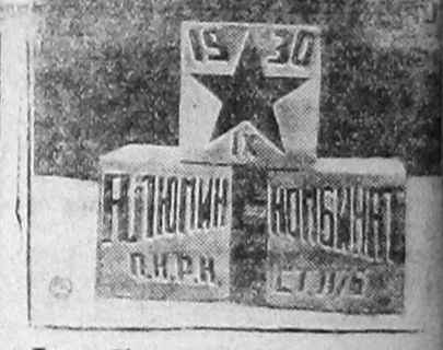
Близ Кичкаса состоялась закладка алюминевого комбината. Комбинат будет питаться током Днепростроя. НА СНИМКЕ: камни заложены на месте, где будет строиться комбинат.

на общественных работ, на руднике «Красный Профинтерн» в ряды ВКП(б) вступило 30 старых шахтеров, на руднике «Красный Октябрь» — 37.