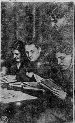
Вечерние общеобразовательные курсы, организованные на придельной ткацкой фабрике «Советская Звезда» в Ленинграде.