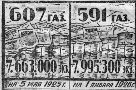
На 5 мая 1925 года в СССР насчитывалось 607 газет с общим разовым тиражем—7.663.000 экз. К началу текущего года количество газет уменьшилось до 591 за счет закрытия слабых и малоинтересных газет; зато общий разовый тираж газет увеличился до 7.995.300 экз.