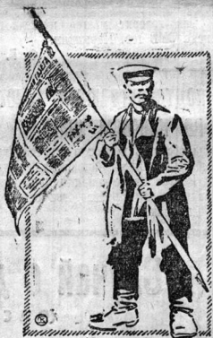
Селькор, держи высоко знамя.