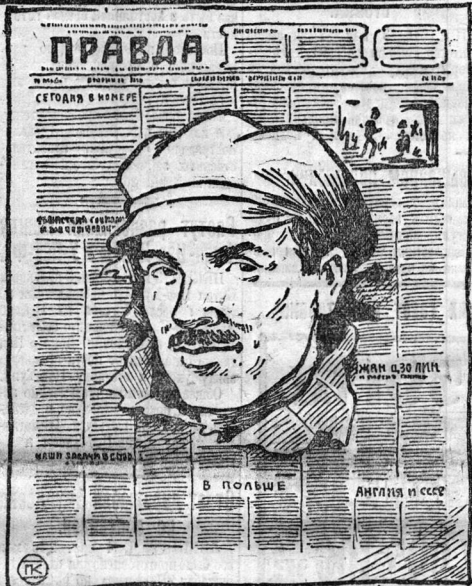
Привет сегодняшнему имениннику—рабочей печати и рабочему классу!

В 1923 году уже имели место одной «Правды» 332 газеты с тиражем в 1.237.305. В 1924 году—589 газет с тиражем около 6 миллионов, а в текущем году 507 газет с тиражем 7.062.191.