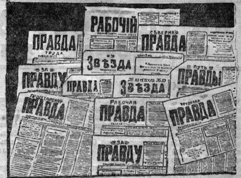
Газета «Звезда» «Правда» (1911—1914 гг. с видоизмененными заголовками из-за частых закрытий газеты царской полицией.

стенистские и меньшевистские. Большевистские газеты были «Вперед», «Пролетарий», «Новая Жизнь», «Волна» и «Эхо»; меньшевистские: «Искра», «Начало», «Народная Душа» и др. Разглагольшаясь реакция после по-