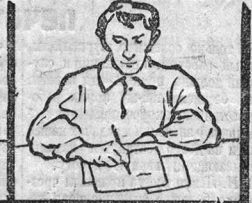
На 5 августа 1925 г.