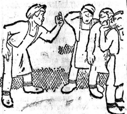
Я вам не даром говорю, безопытные люди, местком для вас важнейшее дело.