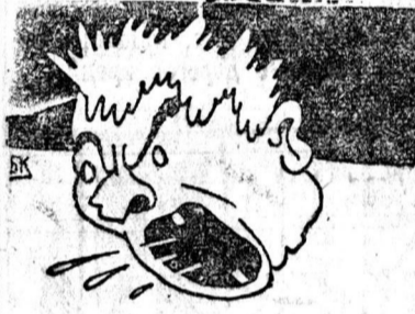
Нельзя ли этого молодца выбросить за борт?