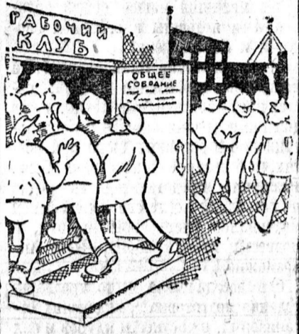
На выборы месткома.