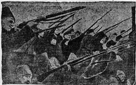
Восставшие войска и народ расстреливают здание, где заседали городские с пулеметами.

зом войны, которую вела царская Россия с Германией.