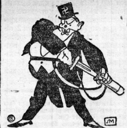
МАЛЬБРУГ В ПОХОД СОБРАЛСЯ! Рис. Л. М.

Объединенный союз машиностроителей созывает 13 марта национальный совет союза.