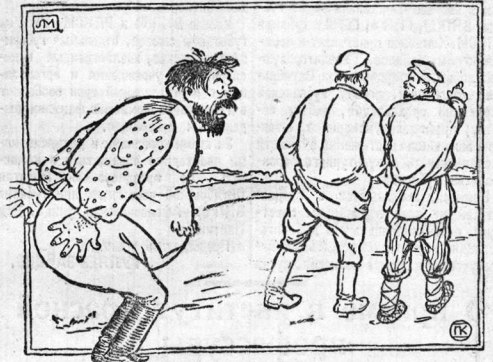
До перевыборов в совет Кулак в селе мечтал быть силой, Теперь не мил бедняге свет, Его согнуло и скрутило. На сердце — камень, в глотке — ядом В башке — туман, трясется ноги: «Ох! Сердечня за бедняком»