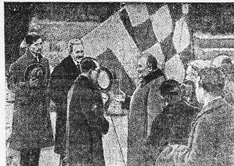
Тов. Чичерин приветствует турецкого министра г. Тевфика Рушди-бей в порту в момент высадки его на борт.

МОСКВА, 17 ноября. Утреннее и вечернее заседания расширенного пленума Исполкома Коминтерна Молодежи 16-го ноября были целиком посвящены общему политическому отчету, составленному секретарем Исполкома Коминтерна Молодежи тов. Ломинадзе. Оставаясь на вопросах взаимоотношений союза с партии и другим организационным вопросам, Ломинадзе подчеркивает, что за отчетный период все секции КИМ в основном проводили правильную политическую линию. Оппозиционные течения не нашли отклика в секциях КИМ'а.