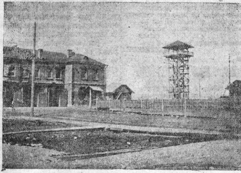
Один из моментов нынешней стройки на ф-не «Сокол».