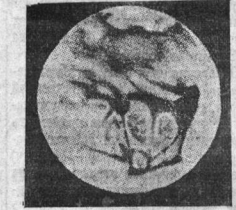
Марс — 11 августа 1924 года (виденный в 240-миллиметровый рефрактор обсерватории в Женеве).