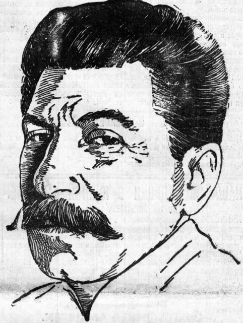
ТОВ. СТАЛИН. Генеральный секретарь ЦК ВКП(б).

ФРАНК РИППИНГЛЬС — 13-летний школьник г. Детройта (Америка) — самый молодой пилот в мире. Третьим полет Франка был совершен. Ему было 12 лет. 13-летний пилот является членом младшей национальной авиации. С. А. С. Ш. «Минимально летает на военных зарплатах и легко делает воздушные леты».