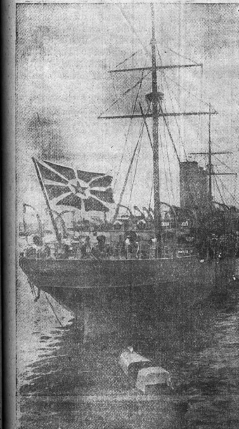
Учебное судно „Комсомолец“.

Бухуют волны Воловоротом, Пенятся гребни Сельх громад. Клокочет море В восторге диком, Справляя Пенный маскарад. Рабочий крейсер В руках могучих, В раз Испытаний в бою, Ему не страшен Шум волн кипучих. Фер бури Не внушает страх. А волны моря — Селье, злые Клокочут, Скача в своей стихии Они то злятся, То вдруг хохочут, То тихо плещут В своем бесовии. Вперед же смело, Без колебаний К вдали Светящим маякам. Смотри на запад, Там слышны стоны; Мы победить Должны и там.