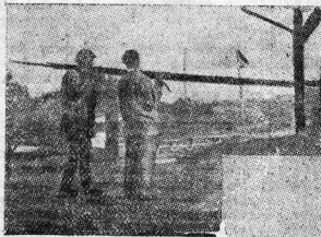
Грузчики на Вологодской пристани.