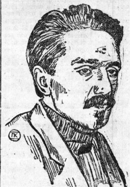
ТОВ. МИКОЯН, А. И.

МОСКВА, 14 августа. Президиум Центрального Исполнительного Комитета Союза Советских Социалистических Республик постановил: Освободить тов. Каменева от обяза-