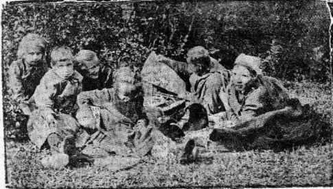
Рабочая семья; в лесу, на отдыхе. За чтением «Красного Севера».