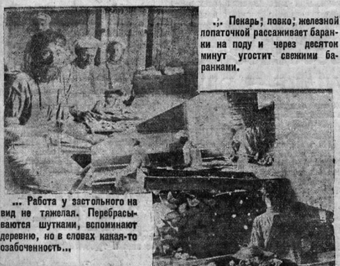
... Работа у застольного на вид не тяжелая. Перебрасываются шутками, вспоминают деревню, но в словах каясь то особая озлобленность...