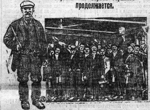
Рабочие последней смены шахты Хилтон-Мэн-Кольер поднимаются на поверхность. Следующая смена уже не приступит к работе. Слева — человек текущего момента

та» (как его называют буржуазная пресса): тип английского углекопа. (Из англ. рабочей газеты «Дейли Геральд».)