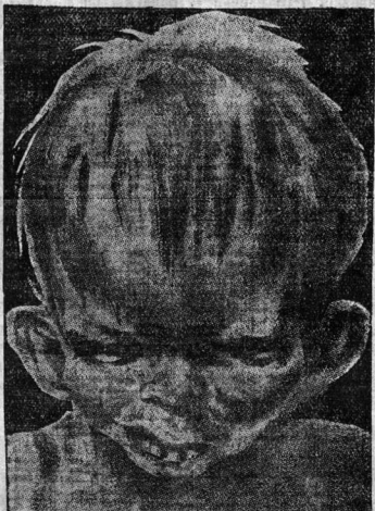
БЕЗ ВИНЫ ВИНОВАТЫЙ.

Пьянство является в настоящее время и социальной болезнью и социальным несчастьем. Оно разрушает здоровье населения подталкивает народное хозяйство, задерживает экономическое и культурное строительство, мешая нашей борьбе за поднятие производительности труда и качества продукции.