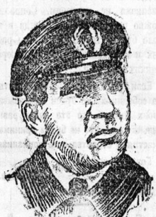
Тов. Зюб.—Комиссар морских сил СССР.

Поэтому, силе буржуазии мы должны противопоставить нашу силу, ибо лучший аргумент, которым можно заставить буржуазию отозваться от всяких новых посятательств на неприкосновенность и безопасность единственного во всем мире пролетарского рабоче-крестьянского государства.